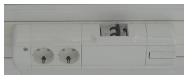
eluttag i KB-skena