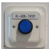
tryckknapp vid kemiskt spill

Efter att kvarter utrymms får endast behörig personal beträda lokalen till dess att sanering utförts.