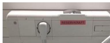
reservkraftsuttag i KB-skena