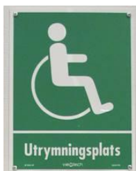
skylt vid utrymningsplats

En tillfällig utrymningsplats är placerad i egen brandcell och är utrustad med en nödtelefon för tvåvägskommunikation. När den röda tryckknappen trycks in, vidarekopplas ett larm till plats bemannad dygnet runt. Det upprättas en talkommunikation med den nödställda och undsättning kan ske.