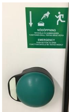
nödöppning plan 2