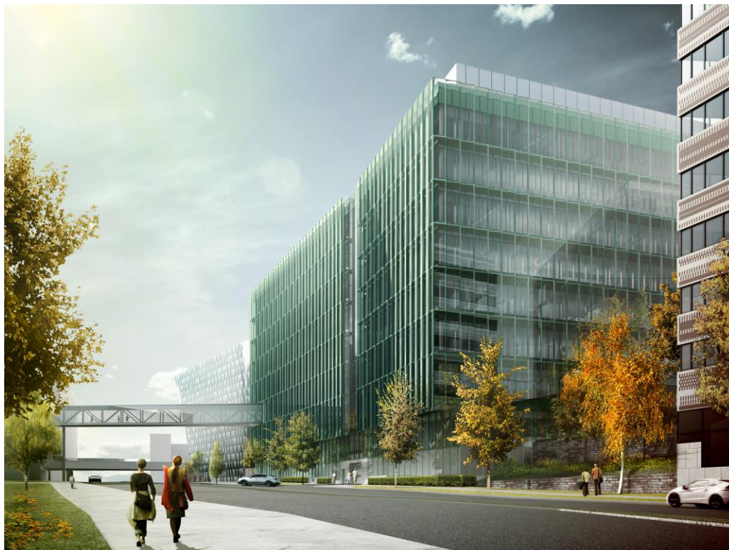
Illustration Arkitekt: CF Møller