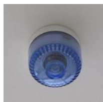
blyxtljus kemiskt spill