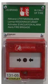
tryckknapp vid brand

Efter att två rökdetektorer detekterat brandrök vidarekopplas ett brandlarm till SOS Alarm. Du kan själv utlösa brandlarmet med hjälp av röda tryckknappar i utrymningsvägarna.