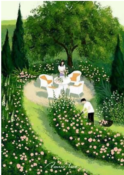
Illustration by Paco Yao

Gothenburg promised to optimise school admissions with a piece of code. The resulting chaos showed how unaccountable systems are ruining lives. I took an algorithm to court in Sweden. The algorithm won | Charlotta Kronblad | The Guardian