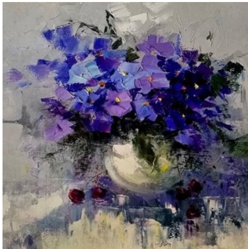
Art Eva Dragan

Etikbevakningen ska vara till nytta för så många som möjligt. Anmälan görs till marie.chenik@ki.se och prenumerationen avslutas genom att använda Avregistreringslänk Nyhetsbrev för 2026 (sammanställningar månad för månad) publiceras på: Nyhetsbevakning om etik | Karolinska Institutet . Tidigare nyhetsbrev, från 2016 tom 2025, kan man ta del av genom arkivet@ki.se För att veta mer om mitt projekt finns en rapport (maj 2025) på svenska och engelska. https://ki.se/media/273200/download?attachment I den berättar jag om mitt mångåriga arbete med nyhetsbrevet och om vad mottagarna har svarat (i en enkät) att de skulle sakna om nyhetsbrevet stoppades.