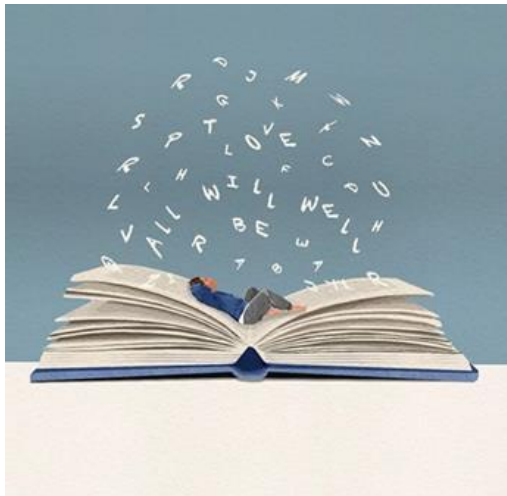
Illustration Alev Neto

Etikbevakningen ska vara till nytta för så många som möjligt. Anmälan görs till marie.chenik@ki.se och prenumerationen avslutas genom att använda Avregistreringslänk Nyhetsbrev för 2026 (sammanställningar månad för månad) publiceras på: Nyhetsbevakning om etik | Karolinska Institutet . Tidigare nyhetsbrev, från 2016 tom 2025, kan man ta del av genom arkivet@ki.se . För att veta mer om mitt projekt finns en rapport (maj 2025) på svenska och engelska. https://ki.se/media/273200/download?attachment I den berättar jag om mitt mångåriga arbete med nyhetsbrevet och om vad mottagarna har svarat (i en enkät) att de skulle sakna om nyhetsbrevet stoppades.