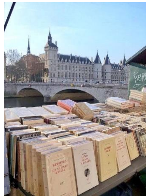
Bild: Paris. Les Quais de la Seine.