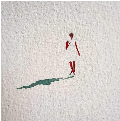
By Spanish artist Carlos Martin.