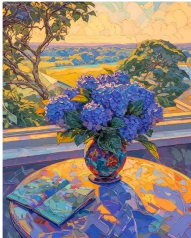
Cobalt Blue Hydrangea.