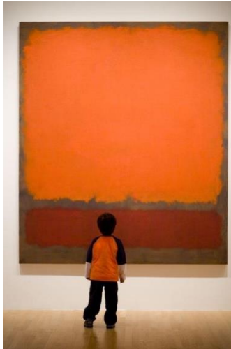
L'effet Rothko . Bild av A. Blaineau.

Om de värsta klimatscenarierna inträffar kommer jorden ändå att överleva, liksom en stor del av befolkningen. Det finns skäl för optimism, skriver Ulla Waldenström. "Samtiden har fel – ett försvarstal för föräldraskapet" - DN.se