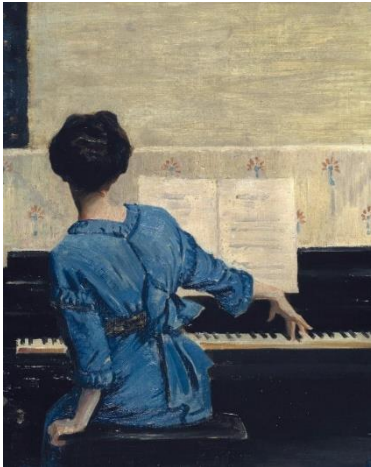
Bild. The keynote. William Merritt Chase. 1915.