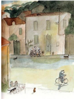
Bild. Village. By Sempé.