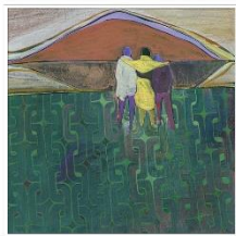
An Ethic of Accompaniment for Surgeons

THE HASTINGS CENTER REPORT VOLUME 54 • NUMBER 2