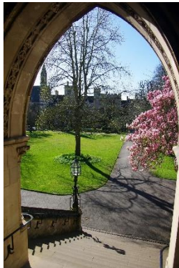
Bild. Magnolia at Oxford. April 2024.

Pressmeddelande. Utökat skydd mot diskriminering i offentlig verksamhet - Regeringen.se