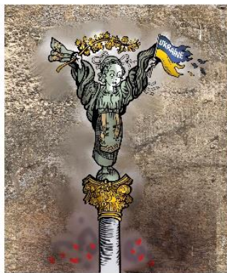
Ukraine. Bild av Plantu (fransk tecknare). 2022.

Synpunkter och förslag välkomnas och skickas till marie.chenik@ki.se