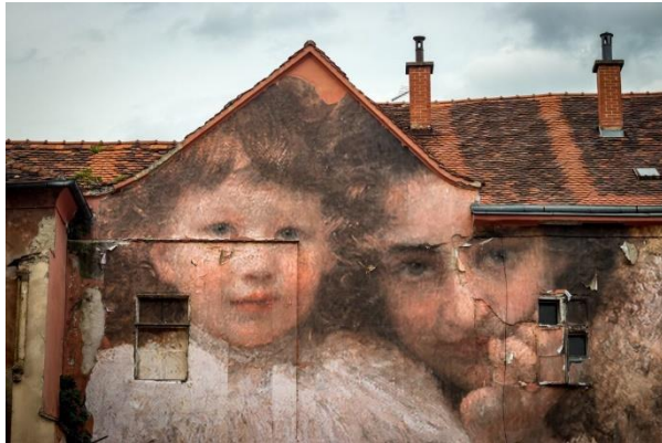
Zagreb, Croatia.

Ny rapport. Bemötande och stöd när barn föds döda (sbu.se)