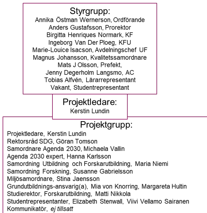
Figur 2 Ett KI för hållbar utveckling - Projektorganisation

Projektorganisationen med medlemskap i december 2021 visas i Figur 2.