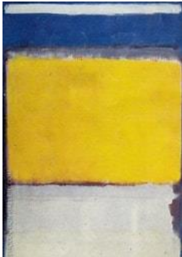
Mark Rothko. Museum of Modern Art. New York.