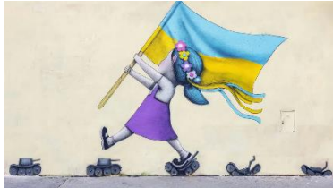
French Street Artist Julien Malland alias Seth. March 2022 Rue Buot Paris 13e.