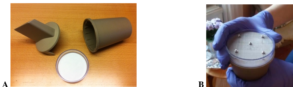
Figur 1. Provtagningsmaterial som användes för insamling av dammprover. A: Filterinsats med monterat cellulosafilter samt tvådelat munstycke. B: Montering av den sil som användes för att filtrera damm inför analyser av flamskyddsmedel.

Metanoltvätt genomfördes inte för de cellulosafilter som användes för analys av bromerade och fosforbaserade flamskyddsmedel. Vid insamlingen av damm för analys av flamskyddsmedel monterades en sil i filterinsatsen som avlägsnade större dammpartiklar (figur 1).