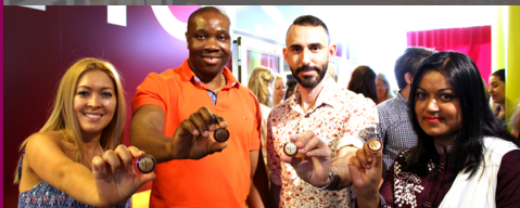
Broschceremoni för nyexaminerade sjuksköterskor.