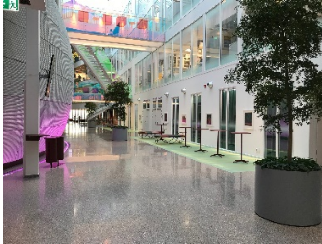
Bild utanför skrivsalen