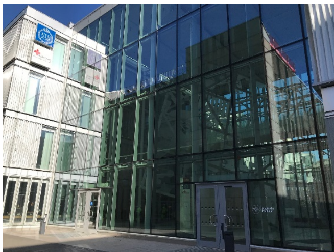
Stora ingången till där skrivsalen finns.